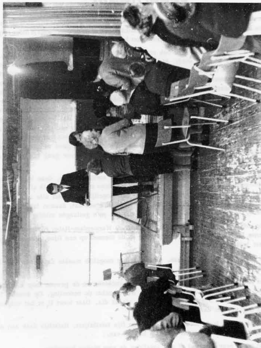
Kien-middag voor de bejaardensoos "Spaarndam"

advies aan Burgemeester en wethouders voor de invoering van éénrichtingsverkeer prioriteit te het fiets- en wandelpad daar gel het toch al drukke verder zal toenemen met de fietsers en voetgangers. weggebruikers hopen wij dan oplossing zal worden gevonden veiligheid kan worden gewaar-