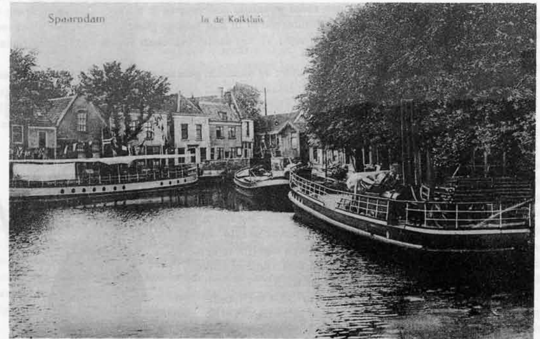
DE KOLKSLUIS — omstreeks 1908